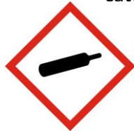
Gaz sous pression

Pour plus d'informations sur la sécurité et la santé au travail consulter le site internet :