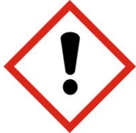
Toxicité aiguë, catégorie 4