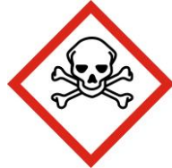
Toxicité aiguë, catégorie 1,2 et 3